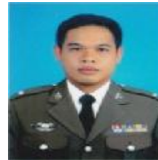
ร.ต.ต.วารวิทย์ ศรีเนตร รอง สว.ฝ่ายพลาธิการ 2 พธ.