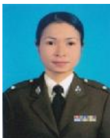
ร.ต.ท.หญิง กิตติยานันท์ เทียงผดุง รอง สว.ฝ่ายพลอากาศ 2 พธ.