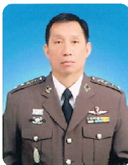
พ.ต.อ. สุเทพ กูยานนท์ ผกก.ฝ่ายพลอากาศ 2 พธ.