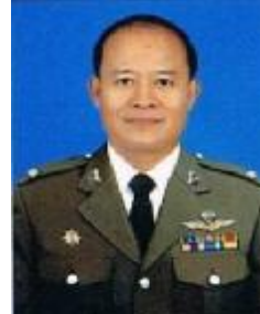
ร.ต.ต. กมล แยมศรวล รอง สว.(อก.) ฝ่ายพลอากาศ 2 พธ.